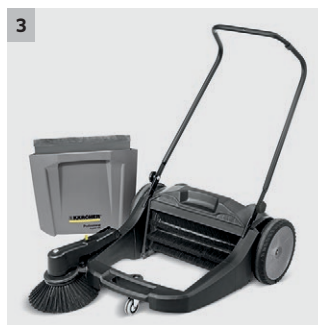
3 Großer Schmutzbehälter