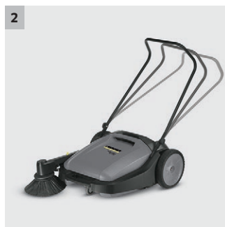
2 Einstellbarer Schubbügel