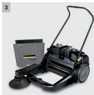
3 Großer Schmutzbehälter